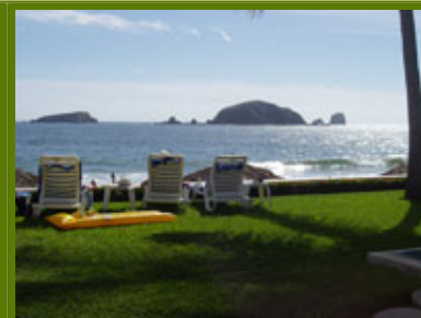
Vista de la playa