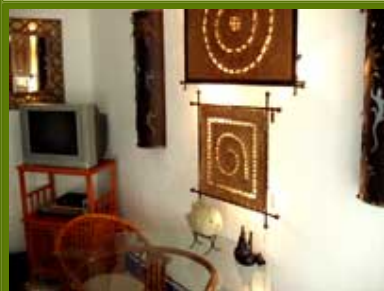
Área de cenar

Haga clic en las imágenes de abajo para miraras en grande