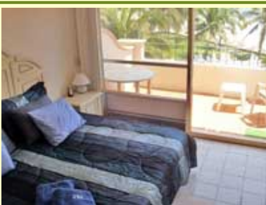
Cuarto de arriba de Ixtapa 251