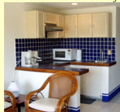
Barra para desayunar