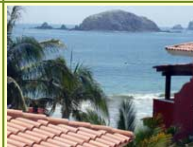
Vista del piso de arriba de Ixtapa Iguana 251