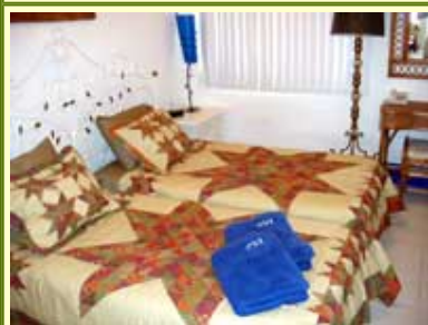
Cuarto de abajo