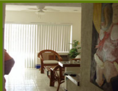
Pasillo a la entrada