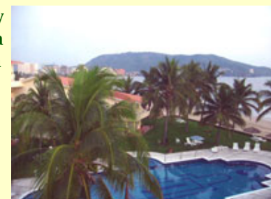
Vista del cuarto de arriba

Elegimos este condominio de dos pisos en el tercer y cuarto piso en Ixtapa por sus vistas superiores y distancia a la playa. Esta más cercano a la playa que otras unidades. La vista desde la sala y la terraza es increíble mirando sobre la piscina y las olas del mar. El cuarto matrimonial de arriba tiene terraza y una vista maravillosa. Tiene una vista arrebatadora de la playa de Ixtapa . El condominio esta amueblado y bien equipado. El cuarto de abajo tiene dos camas que pueden ser juntadas por la ama de casa para que se convierta en una cama grande. Tiene un nuevo acondicionador de aire y ventilador en el techo. El cuarto de arriba tiene una cama tamaño King size y también tiene un acondicionador de aire. También en la sala de recibo, la sofá hace en dos solas camas. Hay dos nuevas televisiones y DVD players. Hemos dejado unas cuantas películas en las cuales usted puede escoger y mirar. La cocina esta equipada con todos los accesorios que uno necesita. Hay una estufa de vidrio nueva con cuatro parrillas, ninguna unidad tiene horno. Junto con trastes nuevos, hay platos y vasos de plástico que los puede sacar al lado de la piscina. El Iguana tiene un restaurante y bar que no esta abierta al publico.