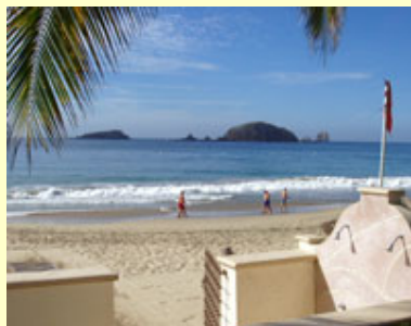
Entrada a la playa

Este condominio amueblado localizado en la parte superior del hotel es de 2 pisos. Tiene 2 cuartos y 2 baños, esta localizado en la mejor parte de la playa principal de Ixtapa, México. Esta retirado de los hoteles grandes, pero esta solamente a una distancia donde puede llegar caminando, tomando un taxi o bus. Puede tomar un bus al cruzar los parqueaderos de la entrada de Ixtapa Iguana, que tan solo cuesta 50 centavos E.U. a cualquier parte de Ixtapa y 70 centavos E.U. para ir a Zihuatanejo. El bus pasa cada 10 minutos. La marina y muchos restaurantes maravillosos están también al cruzar la calle de los parqueaderos de la Ixtapa Iguana. Es un gran lugar donde cenar y vagar por las tardes. Hay unas cuantas tiendas ubicadas en la marina. Yo no juego Golf (todavía), pero el maravilloso campo de golf esta solamente a una caminata corta.