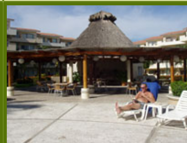
Restaurante y Barra privada