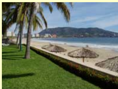
Playa principal de Ixtapa

Este condominio amueblado localizado en la parte superior del hotel es de 2 pisos. Tiene 2 cuartos y 2 baños, esta localizado en la mejor parte de la playa principal de Ixtapa, México. Esta retirado de los hoteles grandes, pero esta solamente a una distancia donde puede llegar caminando, tomando un taxi o bus. Puede tomar un bus al cruzar los parqueaderos de la entrada de Ixtapa Iguana, que tan solo cuesta 50 centavos E.U. a cualquier parte de Ixtapa y 70 centavos E.U. para ir a Zihuatanejo. El bus pasa cada 10 minutos. La marina y muchos restaurantes maravillosos están también al cruzar la calle de los parqueaderos de la Ixtapa Iguana. Es un gran lugar donde cenar y vagar por las tardes. Hay unas cuantas tiendas ubicadas en la marina. Yo no juego Golf (todavía), pero el maravilloso campo de golf esta solamente a una caminata corta.